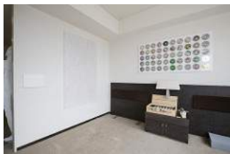
ギャラリーノマル