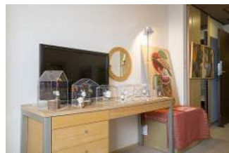
クムサンギャラリー