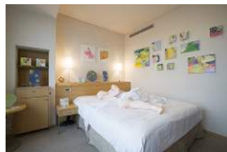
ジルダールギャラリー