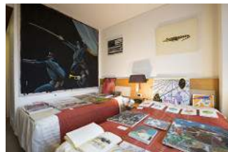
MORI YU GALLERY