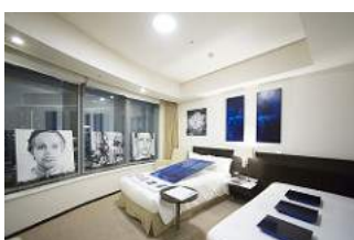
アートコートギャラリー