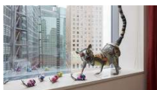
ギャラリー東京ユマニテ