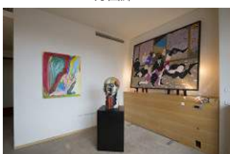
ロイドワークスギャラリー