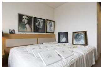
みうらじろうギャラリー