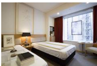
雅景 錐 | 京都・東京