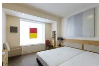
ギャラリーヤマグチ クンストバウ