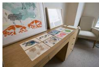
サードギャラリー Aya