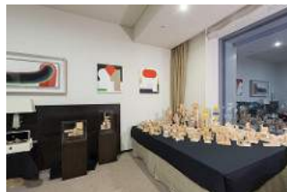
Yoshiaki Inoue Gallery