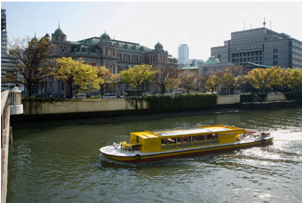
01. アートクルーズ 運行提供：一本松海運株式会社

2023年7月26日(水)～31日(月)の6日間、クリエイティブセンター大阪（名村造船所大阪工場跡地 / 北加賀屋・近代化産業遺産）と kagoo（カゲー / 北加賀屋・元家具屋）の2会場、7月28日(金)～30日(日)の3日間、大阪中央公会堂（中之島・国指定重要文化財）の計3会場で開催する、現代美術に特化したアートフェア「ART OSAKA 2023」（主催：一般社団法人日本現代美術振興協会 | APCA）。