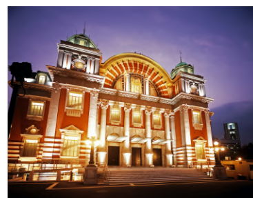
14. 大阪市中央公会堂