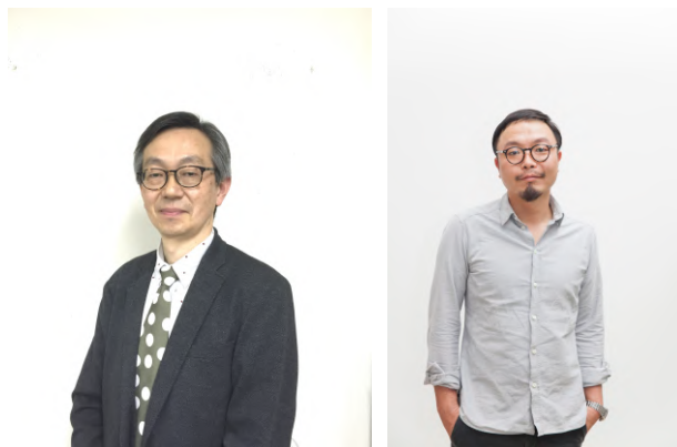
05. 左：島敦彦（国立国際美術館館長）