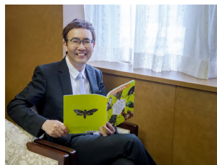
04. 福岡伸一（生物学者 / 作家）