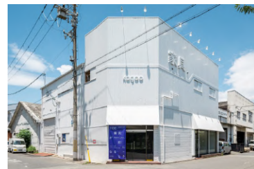
13. kagoo (カグー)