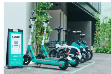
11. LUUP 参考写真

https://ride-your-city.luup.sc/Myjb/cfcd04a