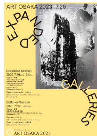
15. ART OSAKA 2023 フライヤーイメージ