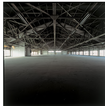
12. クリエイティブセンター大阪 (名村造船所大阪工場跡地)